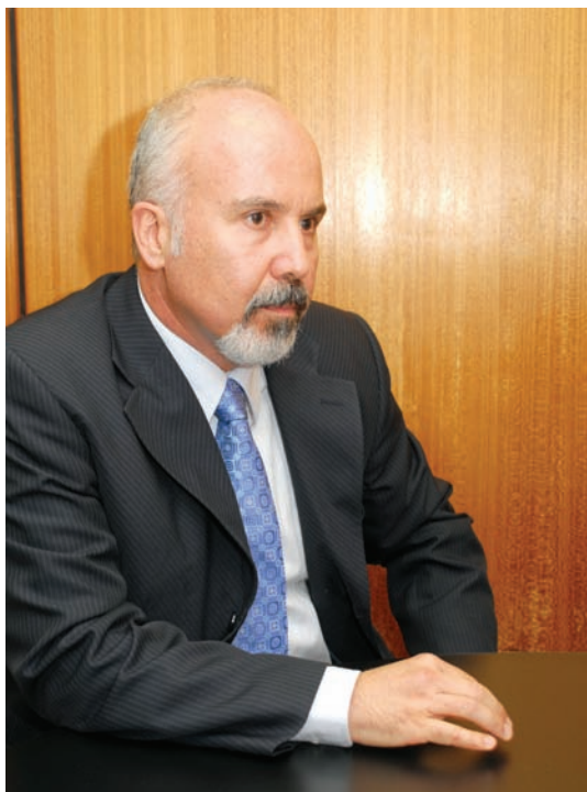
Carlos Alberto Vilhena – procurador regional da República

ceu que os atos não terão consequências. No entanto é possível ampliar os canais de uma justiça com feições restaurativas – particularmente em relação aos crimes contra o patrimônio –, desde que praticados sem violência e grave ameaça. As mazelas sociais devem ser objeto de políticas públicas de inclusão e do Direito em geral: o direito penal certamente não se presta a isso. É equivocado querer resolver tais problemas com a redução impensada do âmbito de efetividade do processo penal.