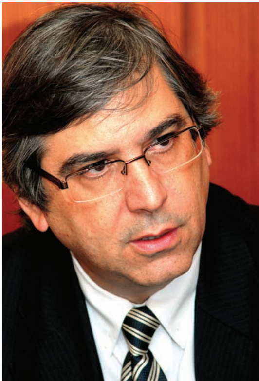
Eugênio Pacelli – procurador regional da República

rias, não é de realização dos desejos pessoais de ninguém. Nós estamos atentos ao que o Parlamento está aprovando. Não temos como ignorar a totalidade dessa matéria. Houve, recentemente, modificações a respeito dos procedimentos do júri, do interrogatório por videoconferência. Podemos ignorar essa realidade que mal ou bem tem um padrão de legitimidade, que é o próprio fato de isso derivar do Congresso Nacional. Nós não estamos desconhecendo essas leis aprovadas. A Comissão quer corrigir eventuais desvios em relação a procedimentos, identificar um pouco melhor o papel do tribunal do júri. Todavia, em relação ao papel do juiz, do Ministério Público e da Polícia, a Comissão parece encontrar-se em uma posição de consenso, ainda que, aqui e ali, não se concorde com a atual fórmula de investigação preliminar. Uma proposta como a da extinção do inquérito policial, por exemplo – ainda que encontre adeptos nas academias e na vida profes-